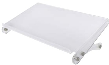
Tischpult IOE DOCC

Sie sitzen aufrecht, rüchenschonend, ohne Nackenschmerzen und Verdrehungen. Ihre Blickrichtung wechselt zwischen Monitor und dem Dokument. Die Augen sind entspannt. Zeitverluste durch dezentrale Blickwechsel entfallen. Die Leistungsfähigkeit und Konzentration wird gesteigert.