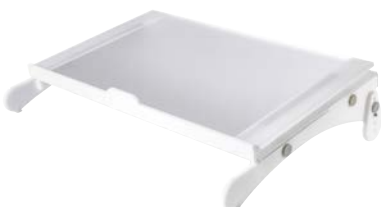
Tischpult IOE MAGG

Arbeitsplatte Acrylglas klar oder gefrostet, Seitenteile klar, 5-fach winkelverstellbar Breite x Tiefe x Höhe: 52 x 30 x 6,5 cm Gewicht: 1,6 kg Höhe hintere, obere Kante: 7 cm, 9,5 cm, 13,4 cm, 16 cm, 19,2 cm Höhe unter der Vorderkante: 5,8 cm