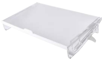
Tischpult IOE FLEXX

Kunststoff verkehrsgrau Integrierte Ablageflächen Breite x Tiefe x Höhe: 51 x 31 x 13 cm, Höhe einstellbar bis 18 cm über EinstellfüÙe Gewicht: 1,8 kg