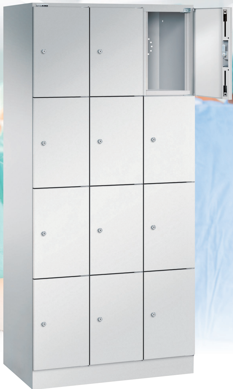
Schließfachschrank (Seite 5)